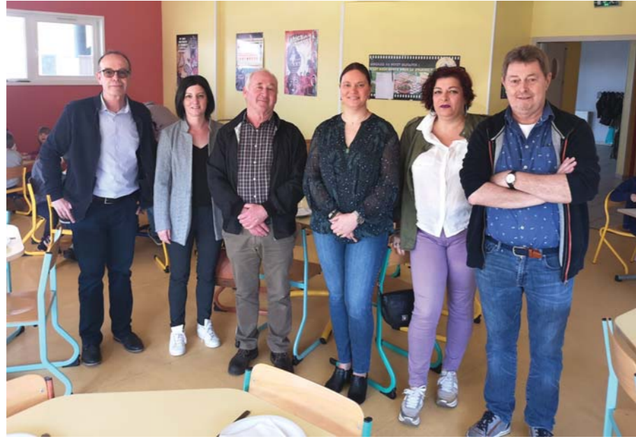
Les élus des trois communes ont déjeuné ensemble à la cantine de Dasle.

Concernant les Centres de loisirs (avec inscription à la semaine), les tarifs seront également réévalués, 10 % pour le QF1, 15 % pour le QF 2 et 20 % pour le QF3. Pour une famille classée QF3, à titre d'exemple, le tarif sera désormais de 50 € pour un centre d'une durée de cinq jours avec le repas de midi. Là encore, les nouveaux tarifs restent compétitifs.