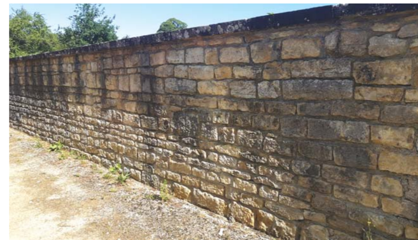
Une partie du mur du cimetière a été rénové.

Des travaux se sont récemment déroulés au cimetière avec la réfection du mur d'enceinte. A propos du cimetière, vous avez peut-être remarqué que les mauvaises herbes étaient nombreuses. Nous vous rappelons que, désormais, les communes ne peuvent plus employer de produits phytosanitaires, le désherbage doit se faire avec des produits naturels ou un décapeur thermique. Un agent communal intervient ponctuellement pour procéder à ces opérations. Les épisodes de pluies augmentent encore le volume de ces mauvaises herbes, la nature reprenant très vite ses droits dès lors que le protocole de désherbage chimique a été interrompu. Il ne s'agit donc en aucune manière d'un manque de respect à nos défunts si certaines zones sont parfois enherbées. Dans tout le village, la commune pratique par ailleurs la fauche raisonnée pour les espaces verts afin de maintenir la biodiversité. Rappelons enfin que les habitants sont tenus de nettoyer devant chez eux, de la même manière qu'ils doivent procéder au déneigement du trottoir au droit de leur propriété.