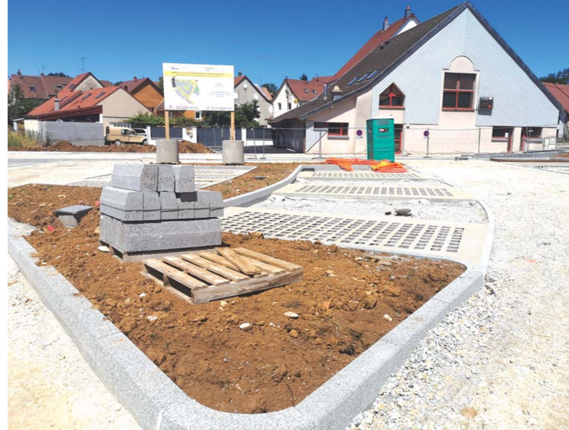
Les travaux d'aménagement du nouveau parking sont aujourd'hui bien avancés.

est déjà achevé et les places matérialisées. A l'extrémité, la passerelle qui reliera le site à la rue des Vergers est déjà en place. Dans ce secteur, Idéha va construire un bâtiment locatif. Le parking devrait rouvrir à la fin du mois de juillet, mais la mise en place des différentes plantations ne se fera qu'à l'automne prochain. A noter qu'un deuxième projet s'est greffé à l'opération, la réfection des façades de la salle Espace-Loisirs. Ce chantier sera réalisé au mois d'août. La salle Espace-Loisirs pourra être rendue aux associations qui y exercent leurs activités à partir de la rentrée.