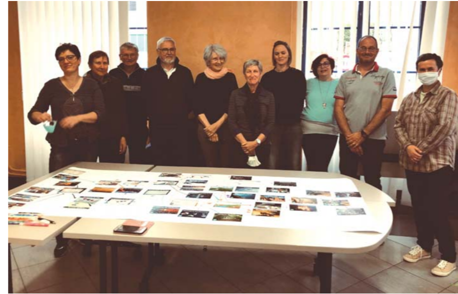
Les membres du groupe 3D veulent sensibiliser les Daslois sur les enjeux climatiques.

Créé en décembre dernier, le groupe 3D (Dasle Développement Durable) est un groupe indépendant de la Mairie, constitué de personnes non élues, volontaires pour s'engager sur des projets en lien avec les enjeux climatiques et sensibiliser les Daslois. La commune soutient toutefois ce projet et pourra apporter son aide logistique et financière pour aider à la réalisation d'actions.