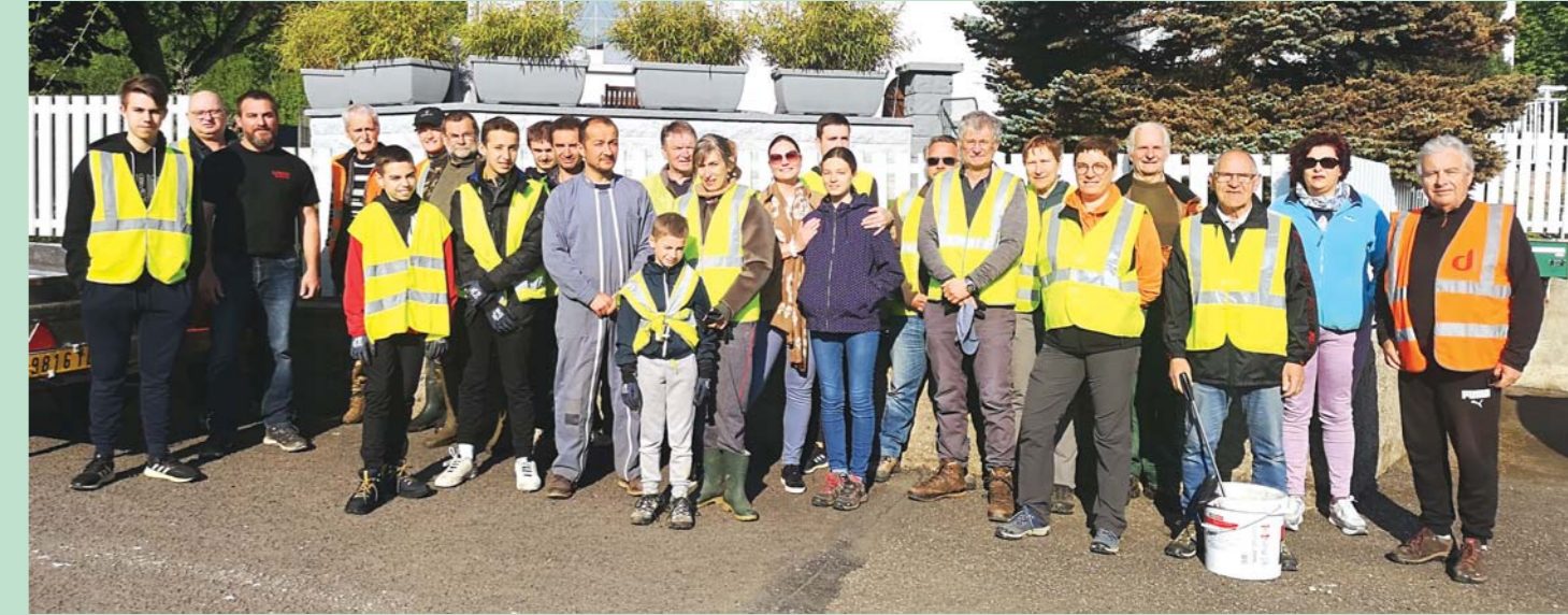
Le groupe des bénévoles ayant participé au nettoyage de printemps.

Environ 25 bénévoles ont participé le samedi 7 mai au matin au traditionnel nettoyage de printemps initié par la Municipalité. La journée a commencé par un petit café aux ateliers municipaux puis les différentes équipes constituées se sont réparties dans différents secteurs du village, arpentant les rues et les chemins pour ramasser les déchets abandonnés çà et là par des citoyens bien indisciplinés. Cela dit, depuis quelque temps, il semblerait que le volume de détritus ramassés soit en baisse par rapport aux années précédentes. C'est peut-être la preuve que de plus en plus de personnes font des efforts et respectent aussi bien la nature que les espaces publics. Mais cette opération reste nécessaire et la Municipalité remercie vivement tous les habitants ayant participé à cette opération pour le beau geste de civisme qu'ils ont accompli au nom de l'intérêt général.