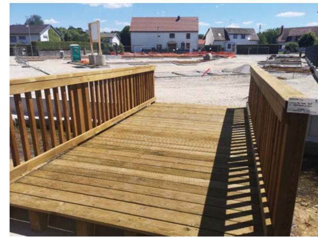
La nouvelle passerelle est déjà en place.

En outre, l'entrée et la sortie de ce parking, jusqu'alors assez dangereuses puisque situées dans le virage, ont été décalées à l'extrémité du parking pour d'évidentes raisons de sécurité. Trois entreprises interviennent sur le chantier, suivi par le bureau d'études Jacquet, maître d'œuvre : Eurovia pour la structure et l'aménagement du parking, Haefeli pour l'éclairage public et Techno-Vert pour la partie espaces verts. A l'heure où nous écrivons ces lignes, la structure du parking