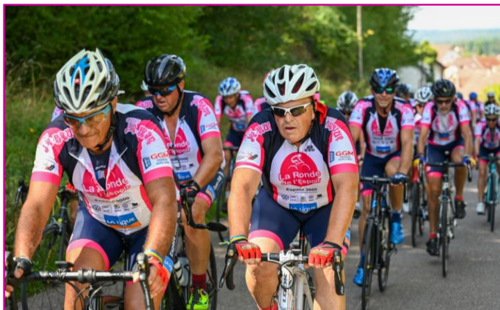
Le peloton en plein effort

55 adhérents 35 cyclistes 7 motards 10 bénévoles "logistique" une caravane de 4 véhicules